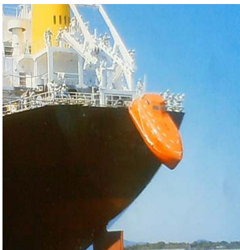
(写真1) 船尾の滑走台を滑り落ちる 自由降下型救命艇

映画の影響もあって、大型船舶の遭難というとタイタニック号を思い浮かべてしまいます。なかでも強く記憶に残ったのは、海に放り出された人と救命ボートの場面でした。