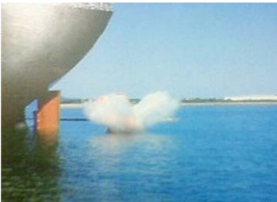
(写真2)海面に落下直後の救命艇 (株)ニシエフの資料から)